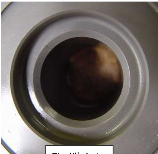
アトマイザーシート