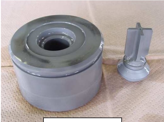
修理前プラスチック