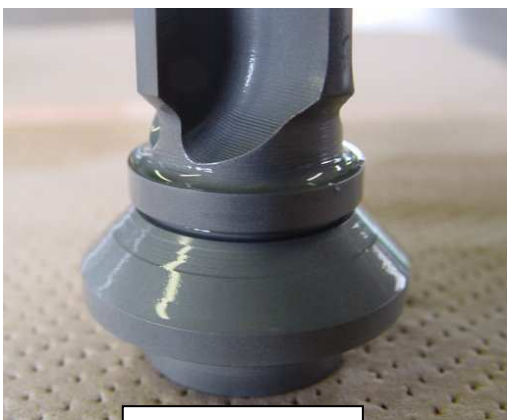
弁シート段差有り